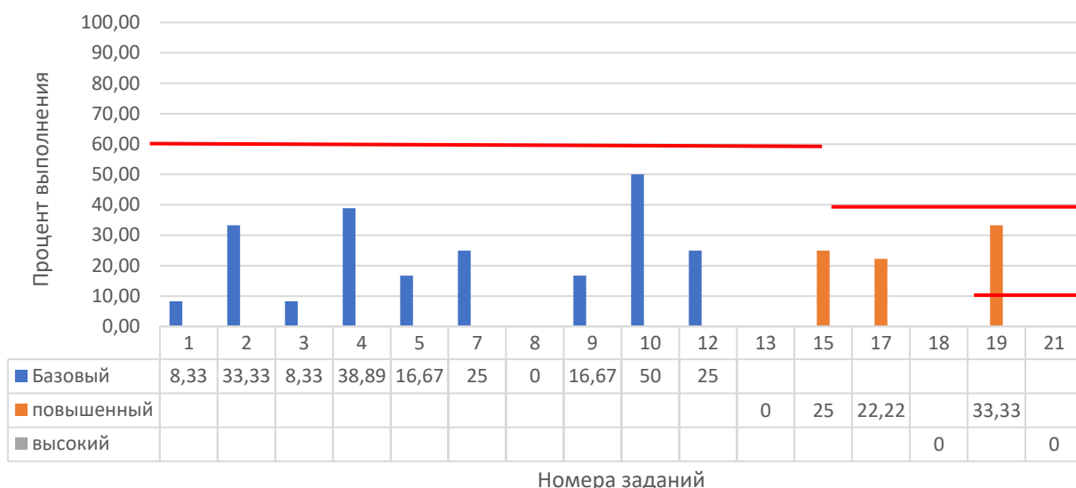
Рисунок 2. Задания, по которым участники не преодолели минимальный порог

На рисунке 2 представлены данные по заданиям (%), уровень выполнения которых не преодолел минимальный порог. Красной линией отражен минимальный порог выполнения для каждого уровня сложности: базовый – 60%, повышенный – 40%, высокий – 10%.